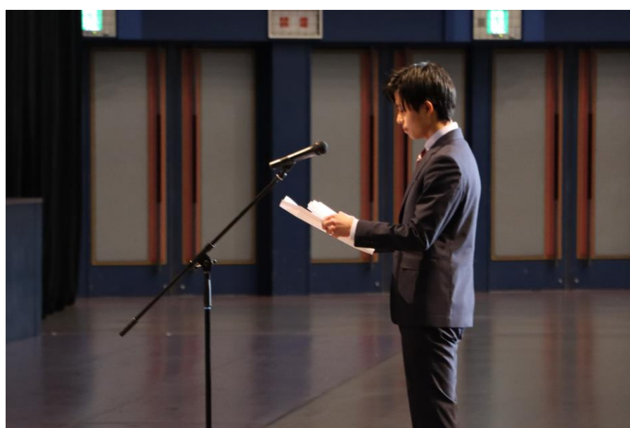
令和6年度徳島大学入学式を挙行了しました